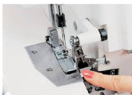
2. Встроенный узкий ролевой шов Встроенный палец ролевого шва позволяет без смены игольной пластины выполнять в позиции "N" обычные строчки и в позиции "R" узкий ролевой шов.