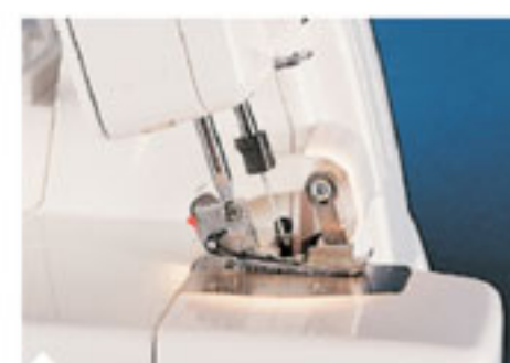
8. Встроенное освещение Рабочая область всегда полностью освещена.