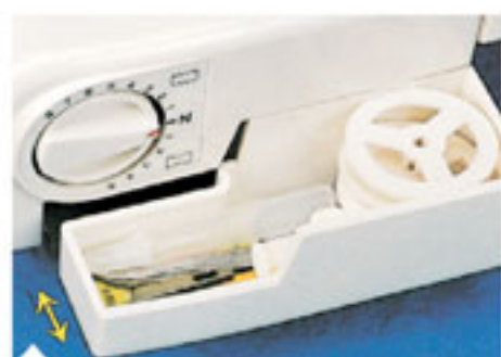
1. Отсек для принадлежностей Все принадлежности всегда находятся под рукой.