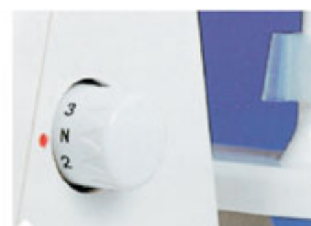
10. Регулятор длины стежка Позволяет точно изменять длину стежка от 1 мм до 4 мм.