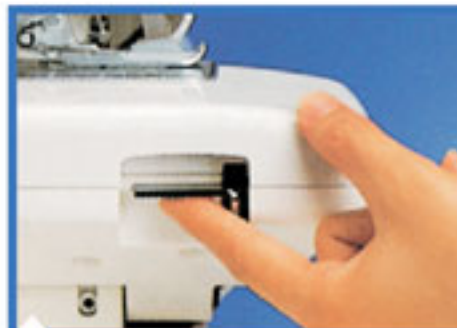
6. Откидной рабочий столик Нажмите на рычаг для опускания столика и доступа к петлителям.