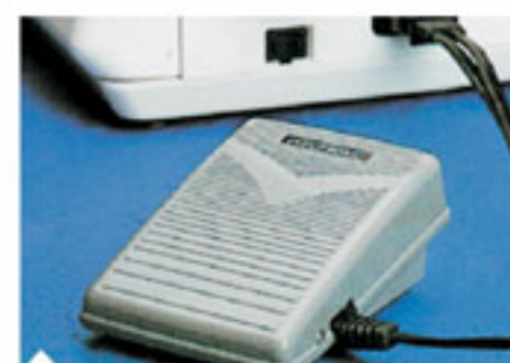
12. Электронная педаль управления Позволяет изменять скорость шитья, освобождая руки.