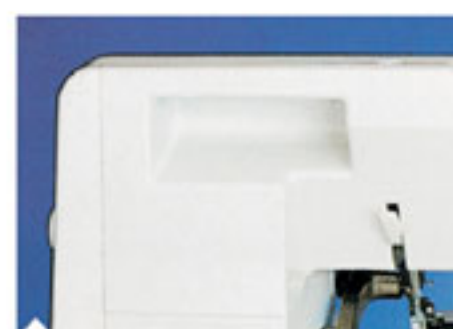
11. Встроенная ручка для переноса Обеспечивает удобную транспортировку.