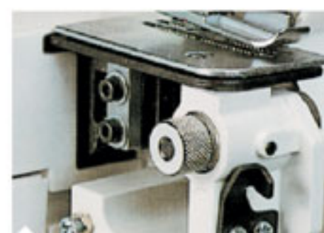
9. Регулятор ширины обрезки Позволяет делать строчки шириной до 7 мм.