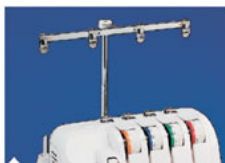
3. Нитенаправитель Новый дизайн нитенаправителя обеспечивает контроль нити исключая ее запутывание.