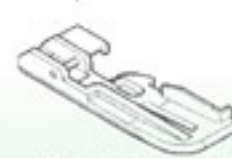
Лапка для вшивания вкладной нити