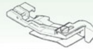
Лапка для сборки