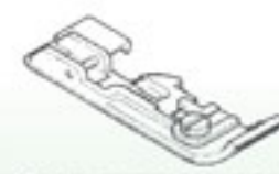
Лапка для прокладывания шнура и канта