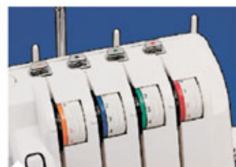
5. Цветные регуляторы натяжения Цветовая индикация всех нитей исключает неправильную заправку.