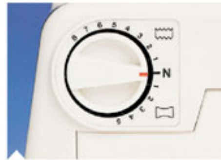
4. Регулятор дифференциала За счет использования дифференциального транспортера материал растягивается или собирается в складки.